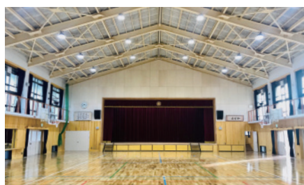
リニューアル後の勤修小学校体育館