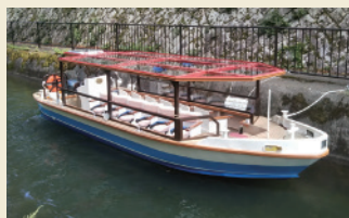
新たに造船された「れいわ号」

京都から大津まで運航している疏水船から山科の景色を楽しんでいただき、山科の乗下船場(四ノ宮舟溜)で下船いただき、山科の名所を散策いただきたいと考えています。