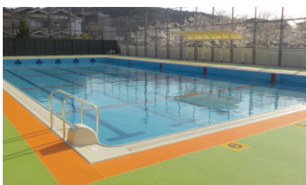
リニューアル後の小野小学校プール